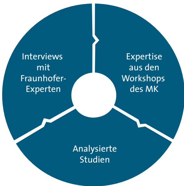
Abbildung 1: Dreiklang als Basis für die Berechnungen

Für die Bezifferung der Effekte intelligenter Netze wurde in dieser Studie ein methodischer Dreiklang gewählt (siehe Abb. 1).