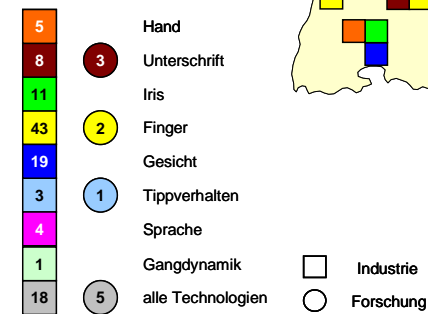
Standortverteilung nach biometrischen Merkmalen